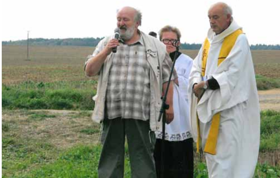
1. 9. 2013 - Jemnice - Želetavská - svěcení Červeného kříže