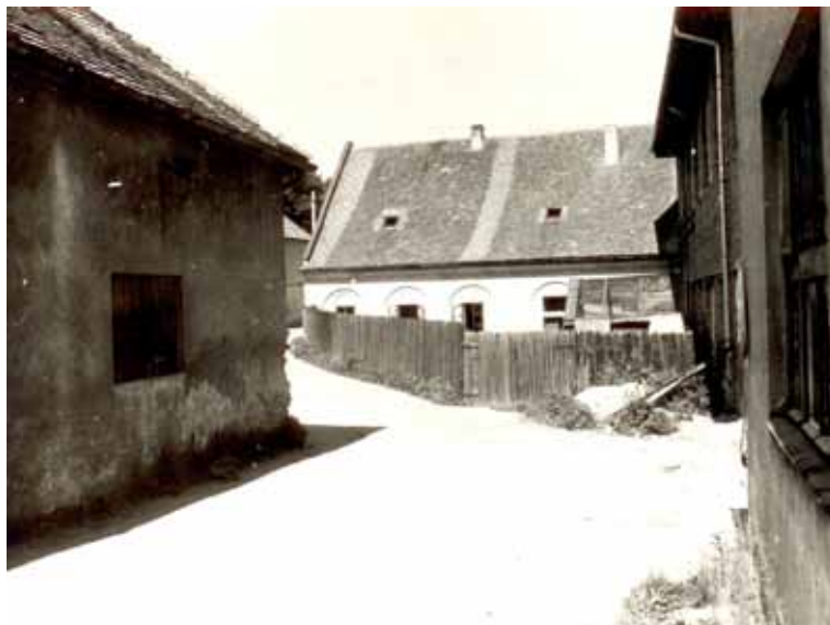
Jemnice – ulice Palackého