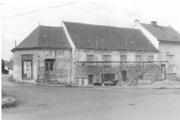
Rok 1990 - Na Podolí - oprava fasády domu č.p. 259, vlevo část původní kaple (zrušena r. 1781)

Jemnické listy č.9/2013 , vydalo město Jemnice, Husova 103, IČ 00289531, 2. září 2013. MK ČR E 13924. Náklad 2.200 ks. kultura@mesto-jemnice.cz, www.mesto-jemnice.cz