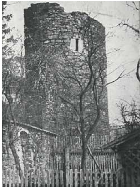
Rok 1928 - Bašta - V Zahrádkách