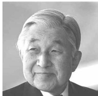
Císař Japonska Akihito

Ve dnech 23. až 27. června 2013 jsem se zúčastnil XI. světového kongresu biologické psychiatrie v japonském Kyotu. Kongres pořádala Světová federace společností pro biologickou psychiatrii (WFSBP) ve spolupráci se Společností pro biologickou psychiatrii Japonska. Celkem bylo přítomno přibližně 2 500 psychiatrů a dalších odborníků z 84 zemí světa.